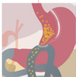
Mini Bypass gastrico