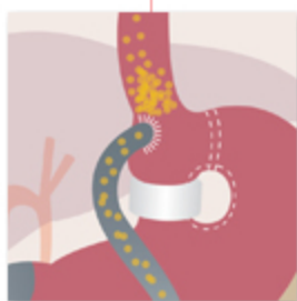
Bypass gastrico funzionale su gastroplastica verticale (Amenta-Cariani)