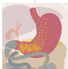
Diversione bilio-pancreatica con conservazione dello stomaco (Vicenza-Padova)