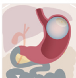
Il palloncino intragastrico