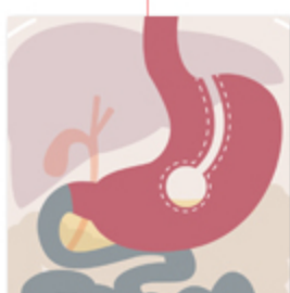
Gastroplastica verticale Magenstrasse/Mill