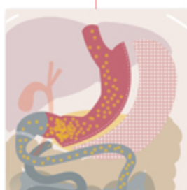
Diversione bilio-pancreatica con duodenal switch