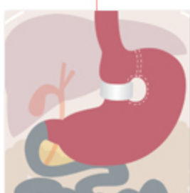
Gastroplastica verticale Mason/McLean