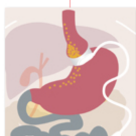
Bendaggio gastrico regolabile

Limitano l'introduzione del cibo con prevalente azione meccanica