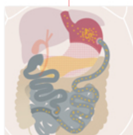
Diversione bilio-pancreatica (Scopinaro, Marceau, Vassallo)

Riducono l'assorbimento del cibo e quindi di energia