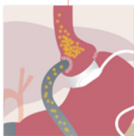
Bypass gastrico funzionale su bendaggio gastrico